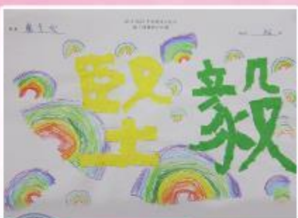
亞軍 B6 盧美欣