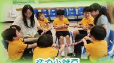
活力小跳豆 Fun Activities for Physical Development