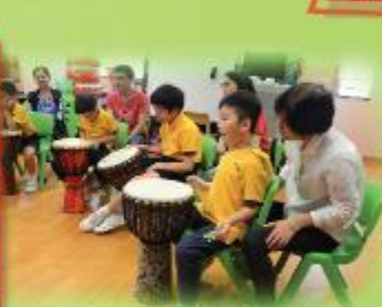
非洲鼓 Djembe Class