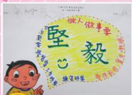
冠軍 B2 謝恩浩