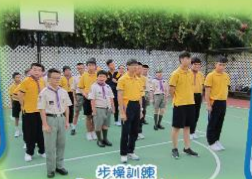
步操訓練 Foot drill training