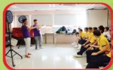
親子飛鏢 Parent-child Darts Class