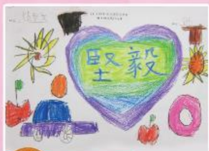
季軍 B5 范卓文