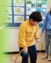
健體樂 Fun Fitness Exercises