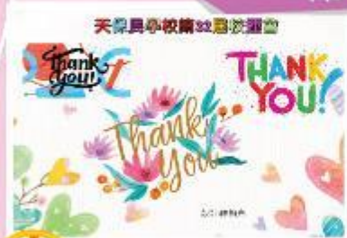
冠軍 B14 陳柏熹