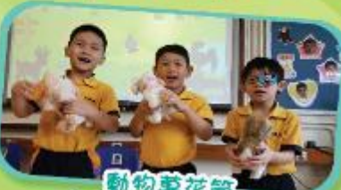
動物黏花筒 Animals' Assemblage