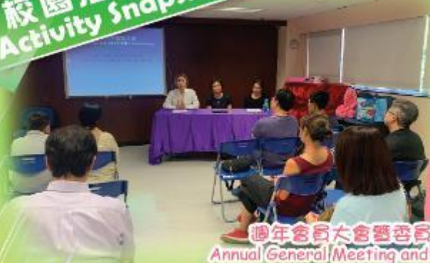
週年會員大會暨委員會(2019-21年度)選舉 Annual General Meeting and 2019-2021 Committee Election