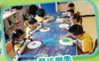
藝坊樂園 Creative Art Workshop