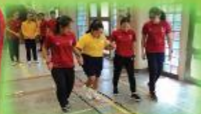
樂力玩 Play Hard Workshop