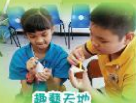
趣藝天地 Fun Art Studio