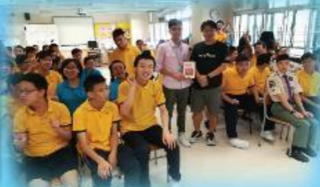
舉辦不同類型的互作坊， 讓學生裝備自己