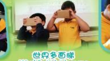
世界多面睇 World's Kaleidoscope