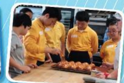
Skill Training and Occupational Exploration