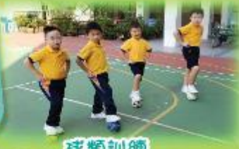
球類訓練 Training of Ball Games