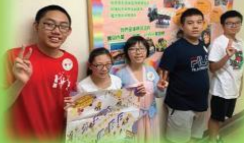
公益便服日 Dress casual day for the Community Chest