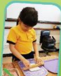
美食製作 Little Cook