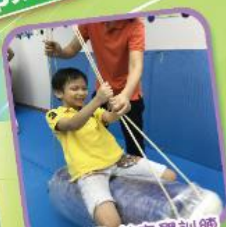
坐鞦韆-前庭覺訓練 Swing: Training of vestibular sense