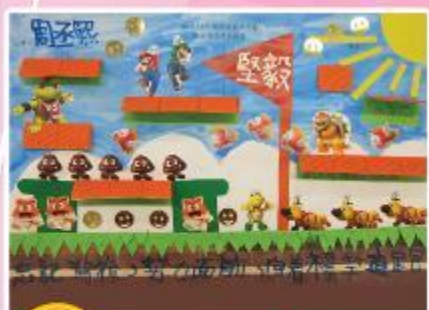
冠軍 B6 周承熙