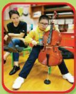
大提琴 Cello class