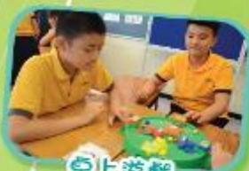
桌上游戲 Tabletop Games