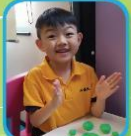
學生以泥嘜作媒介進行小肌肉力量訓練 Students use clays as the medium to train their smaller muscles.