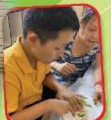
親子小廚師 Parent-child Culinary Class