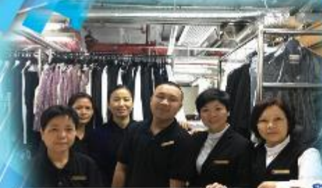
參與外間機構的培訓計劃， 豐富學生的互作體驗