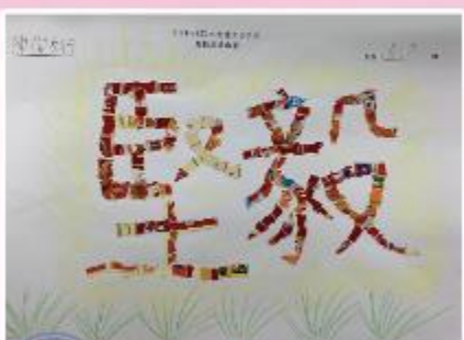
亞軍 B12 陳徹行