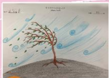
季軍 B11 吳冠熹