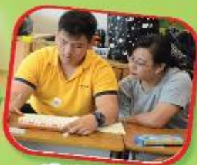
珠心算班 Abacus calculation class