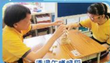
透過午膳時段進行小組遊戲來增進友誼