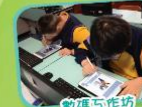
數碼工作坊 Digital Land