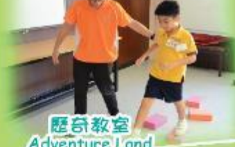
歷奇教室 Adventure Land