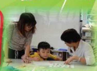
親子綜合繪畫班 Parent-child Integrated Drawing Class