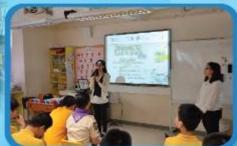
舉辦理財互作坊，讓學生認識理財之道