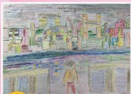
冠軍 B10 叶心港