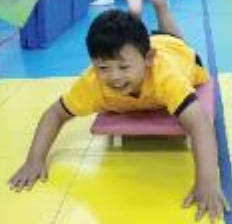
人力車-上肢協調訓練 Rickshaw: Training of the coordination of upper limbs