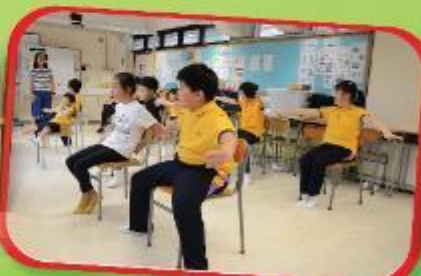
小小舞蹈班 Little Dancing Class