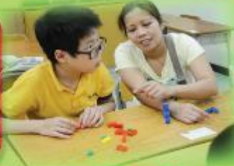
親子LEGO班 Parent-child LEGO class