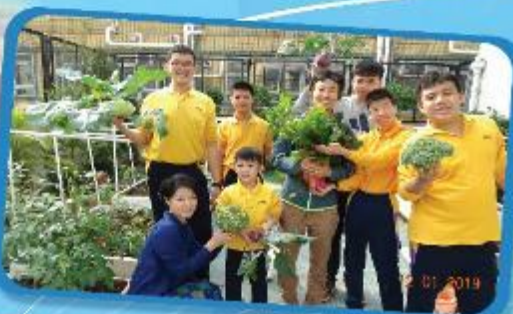
Social Skills and Interest Development