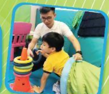
學生透過爬行訓練以增強姿勢控制能力 Students could enhance their postural control capacity by crawling.