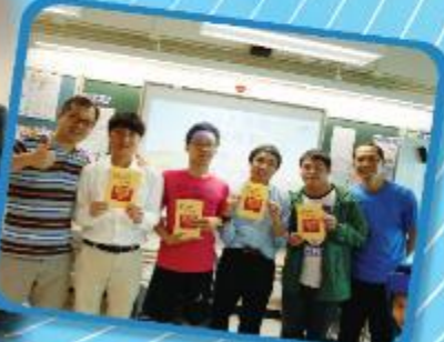
Preparation and Arrangements for Career Pathways