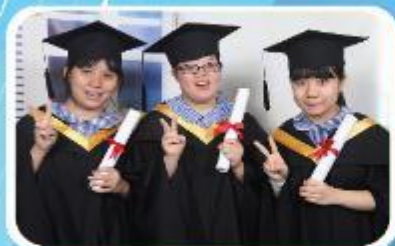
拍攝畢業倩影，留下美好回憶