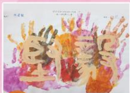
季軍 B1 林彥樞