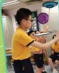
小小歡樂雜耍家 Circus For All