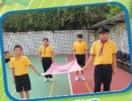
升旗禮儀訓練 Flag ceremony training