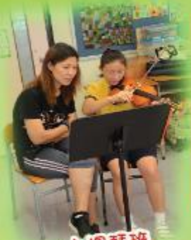
小提琴班 Violin class