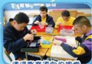
透過職業導向的課堂來提升互作能力