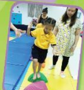
行過石-下肢平衡及姿勢控制訓練 Stone Walk: Training of the lower limbs and postural control