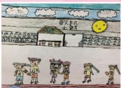
亞軍 B7 龔凱琳