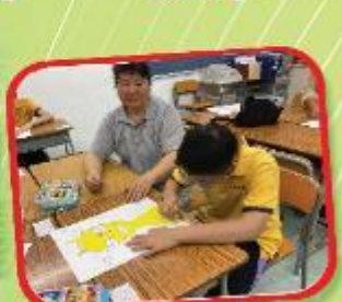
綜合繪畫班 Integrated Drawing Class