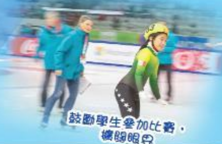
鼓勵學生參加比賽，擴闊眼界