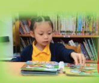
新購玩具快樂坊 New Toys Fun Workshop