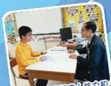
協助學生按照個人能力和喜好去訂立自我實踐目標

本校因應學生成長發展的需要，於小學及初中階段推行成長伴我行計劃，讓學生在小學及初中階段中，按個別需要，進行個別化的實踐計劃。計劃範圍涵蓋學生的自我認識、興趣及能力發展、認識職業、將來就業的規劃和個人時間的管理等，為高中的學習做好準備。