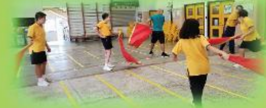
國術訓練 Martial Arts