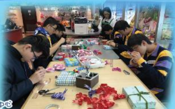
學生到觀塘展亮技能發展中心 進行3天的互作體驗