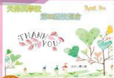
季軍 B11 陳兆南