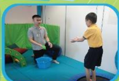
學生透過跳彈床以滿足其前庭覺及本體覺的感覺需要 Jumping on the trampoline could satisfy students' sensory integration including vestibular sense and proprioception.