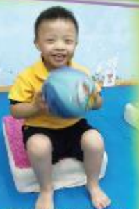
傳球-雙手協調訓練 Passing balls: Training of the coordination of both hands