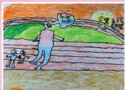
季軍 B7 陳加興