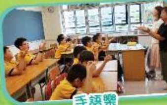
手語樂 Sign Language Fun