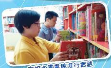
在校內圖書館進行實習