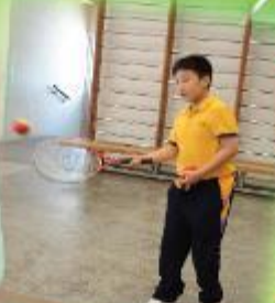
網球班 Tennis class