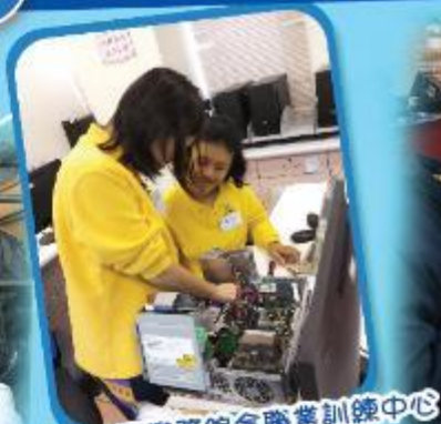
學生到明愛樂務綜合職業訓練中心 進行電腦課程互作體驗