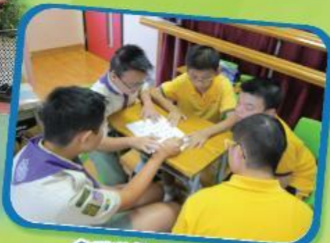
金氏遊戲(視聽訓練) 從遊戲中訓練記憶觀察能力 Kim's Game(with pictures) - Training memory observation ability