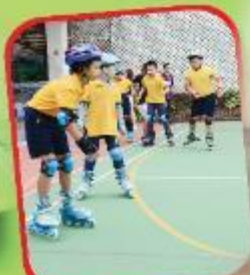
滾軸溜冰班 Roller Skating Course