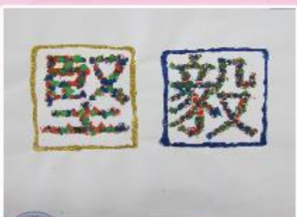
亞軍 B2 陳佩瑤