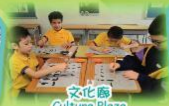
文化廊 Culture Plaza