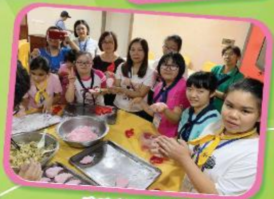
潮汕交流兩天團 Chaoshan Exchange Two-day Tour