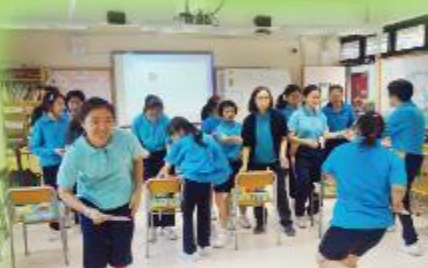
競技遊戲 Competitive activity