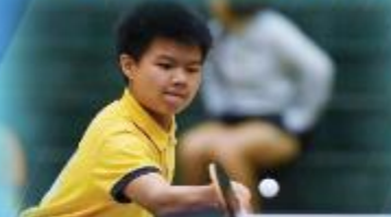
培養學生個人興趣和發展潛能