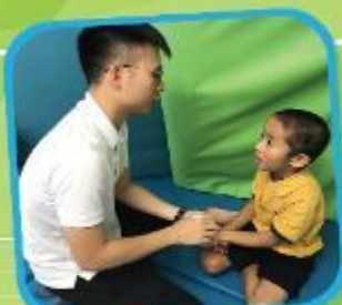
為觸覺敏感的同輩進行「刷身及按關節」治療 Having "Brushing and calming joint compressions" for students with sensory issues.