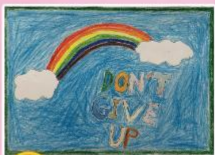
冠軍 B12 王歷天