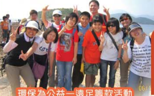
環保為公益—遠足籌款活動