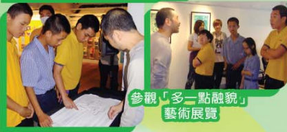
參觀「多一點融貌」藝術展覽