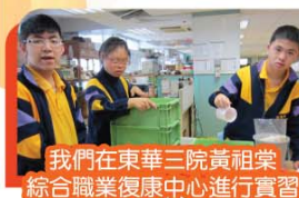
我們在東華三院黃祖棠 綜合職業復康中心進行實習