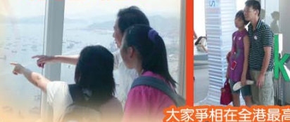
大家爭相在全港最高的觀光樓層拍照留念