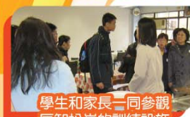
學生和家長一同參觀 匡智松嶺的訓練設施