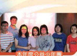
本年度公益少年團 新任委員合照