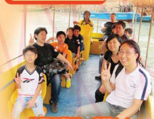
快要出發了，多開心！