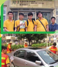
通識教育課堂活動—街市環境衛生匯報