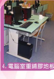
4. 電腦室重鋪膠地板