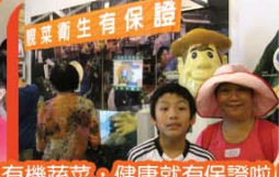
有機蔬菜，健康就有保證啦！