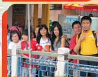
大澳旅行—愉快親子的一天