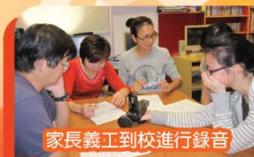
家長義工到校進行錄音

本學年初，保民電台發出通告邀請家長加入廣播義工行列，為學生帶來新鮮感，讓他們更留心聆聽廣播的內容。當收到家長的回應後，我們便陸續邀約他們到校錄音或作即場廣播，亦有家長選擇自行製作錄音送回學校播放，令廣播的節目更豐富。此外，我們首次舉辦的廣播節目創作比賽，得到家長及教職員的支持及參與，收到多份錄音，經校長評審後，比賽結果如下：