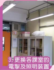
3. 更換各課室的電掣及照明裝置