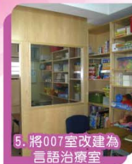
5. 將007室改建為言語治療室