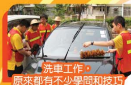
洗車工作，原來都有不少學問和技巧