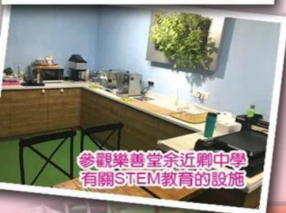
參觀樂善堂余近卿中學有關STEM教育的設施