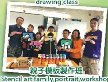
親子模板製作班 Stencil art family portrait/workshop