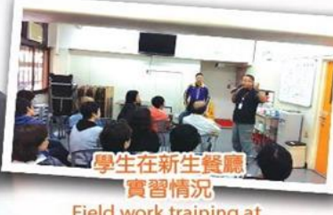
學生在新生餐廳 實習情況