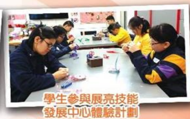
學生參與展亮技能 發展中心體驗計劃