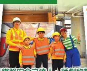
「鐵路安全之達人」話劇欣賞 Drama show