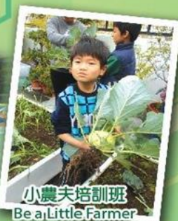
小農夫培訓班 Be a Little Farmer