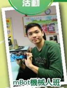
mBot機械人班 mBot-STEM/Robot Class