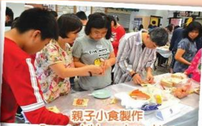
親子小食製作 Parent-child snacks making