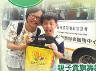
親子賣旗籌款活動 Parent-child flag day for fund raising