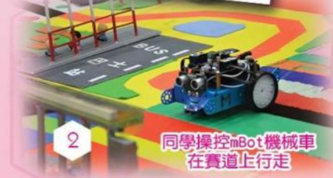
同學操控mBot機械車在賽道上行走