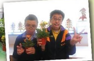
班際種植比賽 Class planting competition