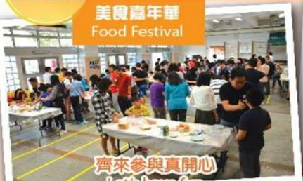
齊來參與真開心 Let's have fun