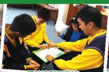
領袖培訓工作坊 Prefect and leader training workshop