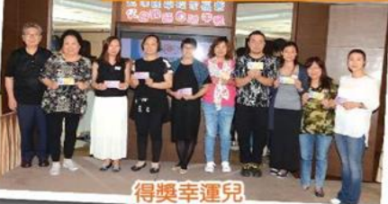
得獎幸運兒 The lucky ones