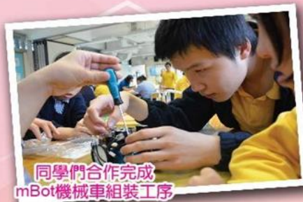
同學們合作完成mBot機械車組裝工序