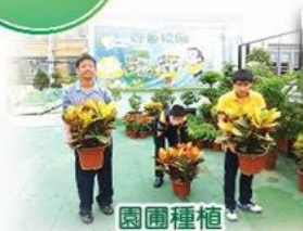
園圃種植 Planting workshop