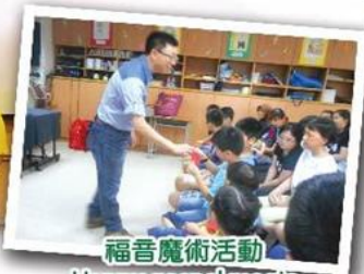
福音魔術活動 Happy gospel magic