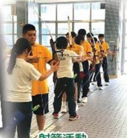
射箭活動 Archery activity