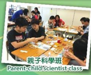
親子科學班 Parent-child scientist class