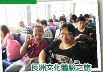
長洲文化體驗之旅 Cheung Chau Cultural Tour