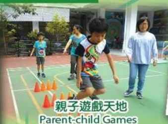
親子遊戲天地 Parent-child Games