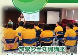
放學安全知識講座 Going back home safety talks