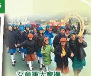
女童軍大會操 Centenary parade and carnival