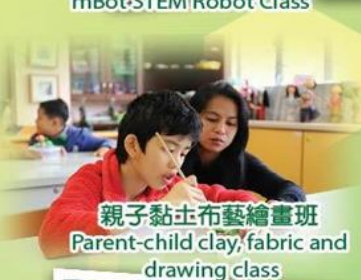
親子黏土布藝繪畫班 Parent-child clay, fabric and drawing class