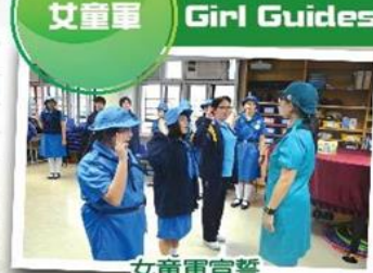
女童軍宣誓 Oath talking