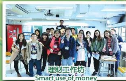
理財工作坊 Smart use of money