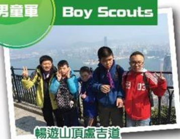
暢遊山頂盧吉道 Hiking at Lugard RD.