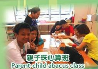
親子珠心算班 Parent-child abacus class