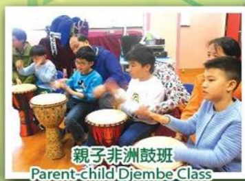
親子非洲鼓班 Parent-child Djembe Class