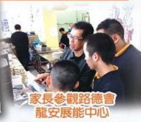
家長參觀路德會 龍安展能中心 Day care center visit