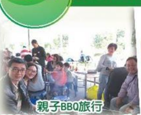
親子BBQ旅行 BBQ at Kam Tin Country Club