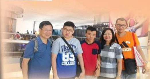
「結伴遊·增見聞」活動 HK international airport sightseeing