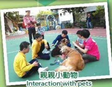
親親小動物 Interaction with pets