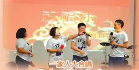
一家人大合唱 Singing with my family