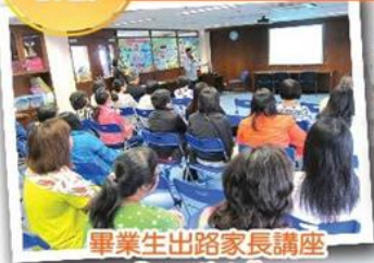
畢業生出路家長講座 Parent's talks