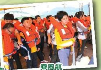
乘風航 Adventure ship