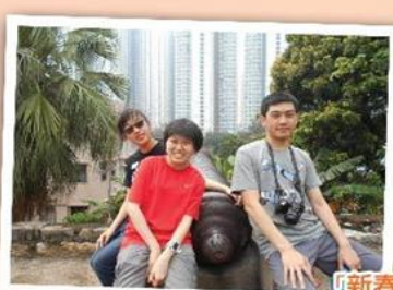
「新春歡樂遊」 Lunar New Year day trip