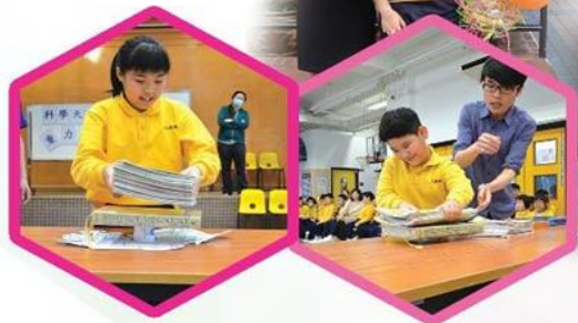
「科學天地」活動花絮

2017年3月23日，學校舉辦了一年一度的大型跨科綜合活動-「科學天地」。小學組的同學在是次活動中，學習利用紙的物料來設計力學橋，比比誰的設計能夠承受更重的書籍。而中學組的同學則要嘗試應用不同的物料，為雞蛋設計保護裝置，以確保雞蛋由二樓投放到地下時能保持完好無缺。最終，大部分的設計都能在全校師生的打氣及見證下成功過關，同學們在嘗試解難的實驗過程中，獲得了很多寶貴的經驗，還有個別的組別，憑著非凡的創意和造型，奪得最佳創意的獎項。